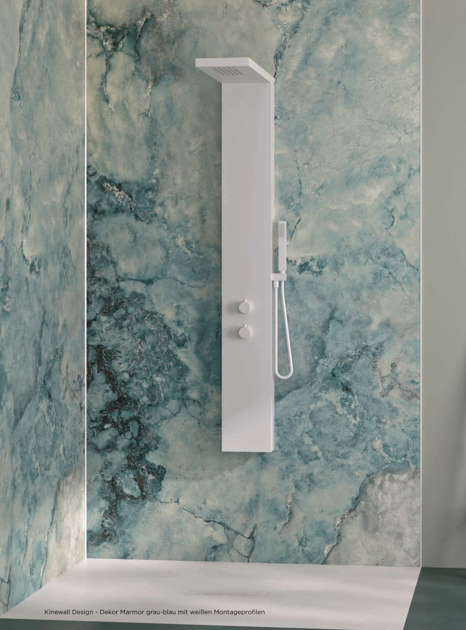
Kinewall Design - Dekor Marmor grau-blau mit weißen Montageprofilen